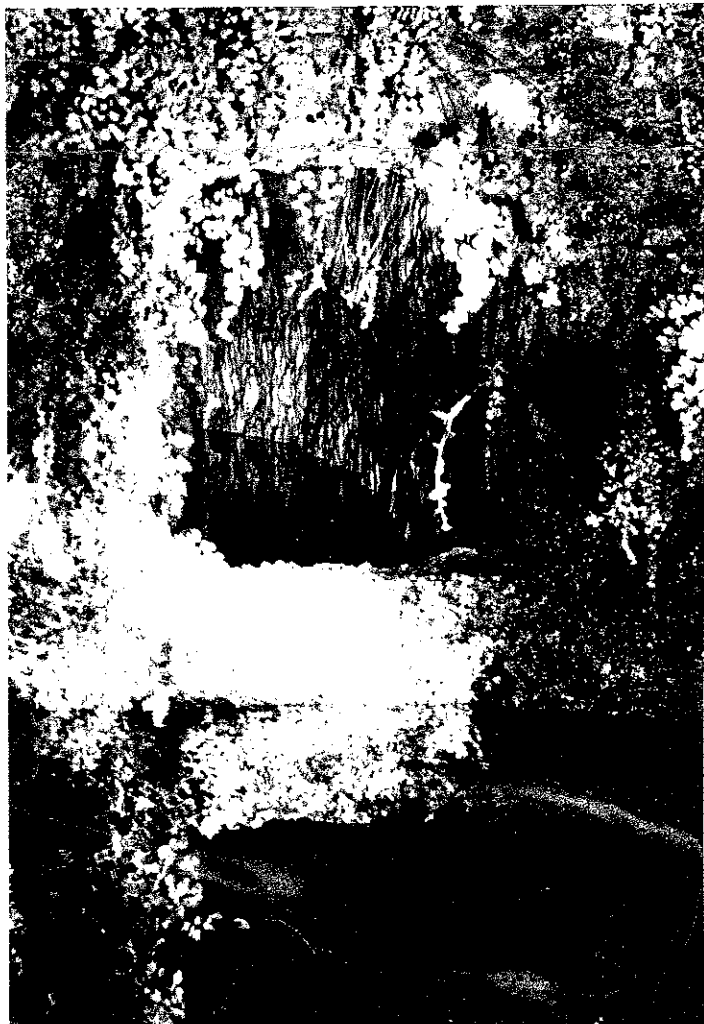
FOTO: 1. Fonte di Via Aretina - 2. Fonte di Porta Tufi

All'esterno, di fronte a questa fonte, si trova inoltre una vasca molto grande, di forma ottagonale e di circa 25 metri di perimetro, delimitata da un basso muretto in mattoni e pietre; anche questa in buono stato di conservazione e di pulizia.